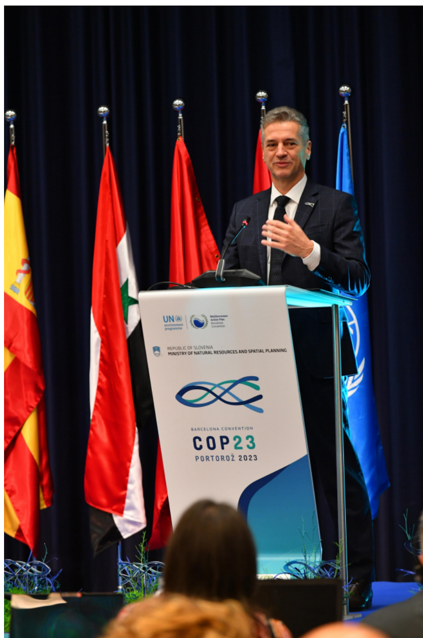
Photo 1 : Intervention de Monsieur le Premier ministre slovène Robert GOLOB