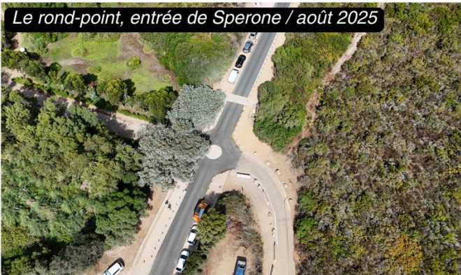
Le rond-point, entrée de Sperone / août 2025