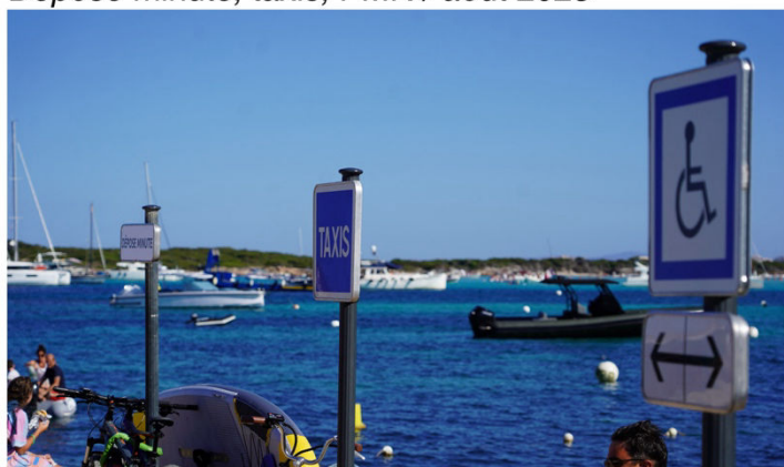
Dépose minute, taxis, PMR / août 2025