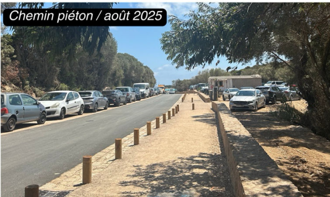
Chemin piéton / août 2025