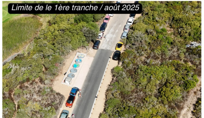
Limite de le 1ère tranche / août 2025