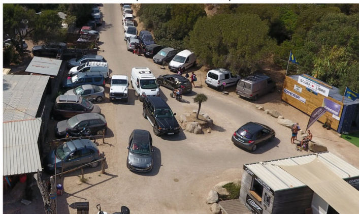
Avant travaux / 2018 (Corsica Drone)