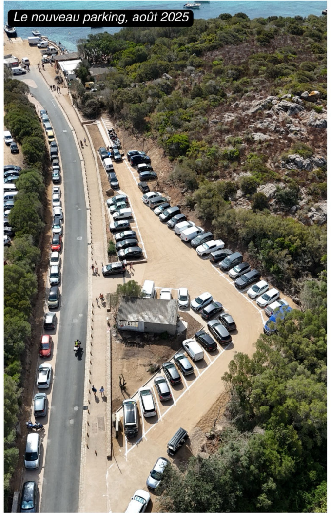
Le nouveau parking, août 2025