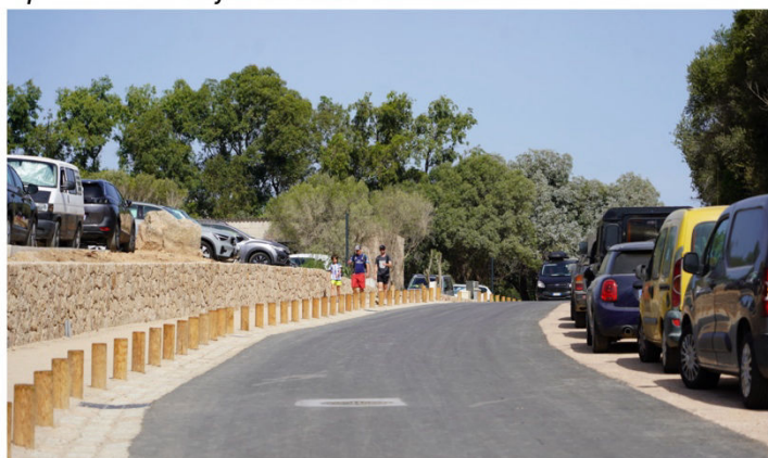
Après travaux / juillet 2025