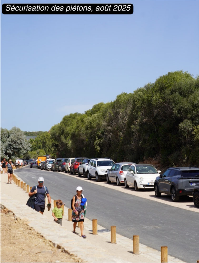
Sécurisation des piétons, août 2025