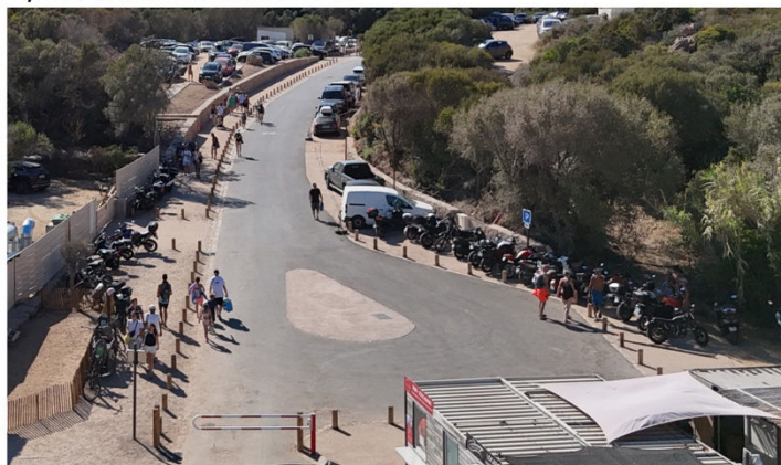
Après travaux / août 2025