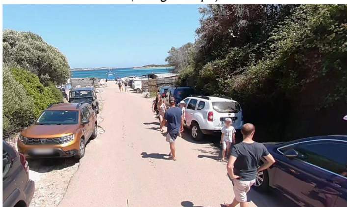
Avant travaux / 2020