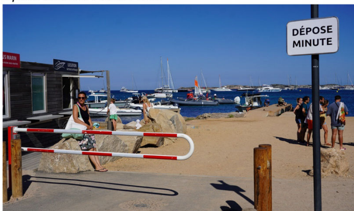
Après travaux / août 2025